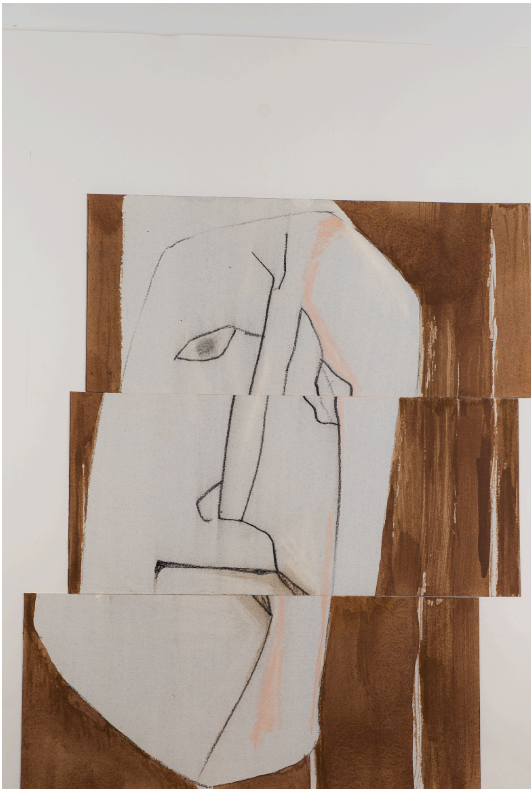
OEUVRE ISSUE DE LA COLLECTION LES GUEULES CASSÉES DE L'ARTISTE JEAN-CLAUDE MORICE