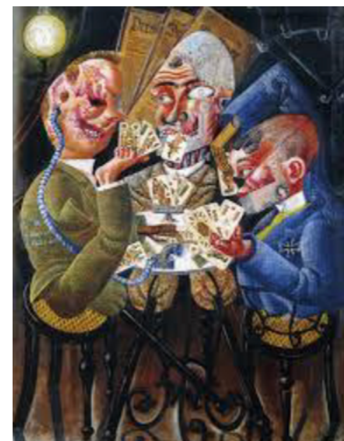
Otto Dix, Les Joueurs de skat 1920

huile et collage sur bois, 110x 87, Neue Nationalgalerie Berlin