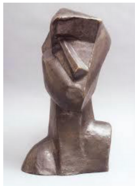
Jozsef Csaky, Tête 1914

https://histoire-image.org/albums/cubisme-guerre-14-18