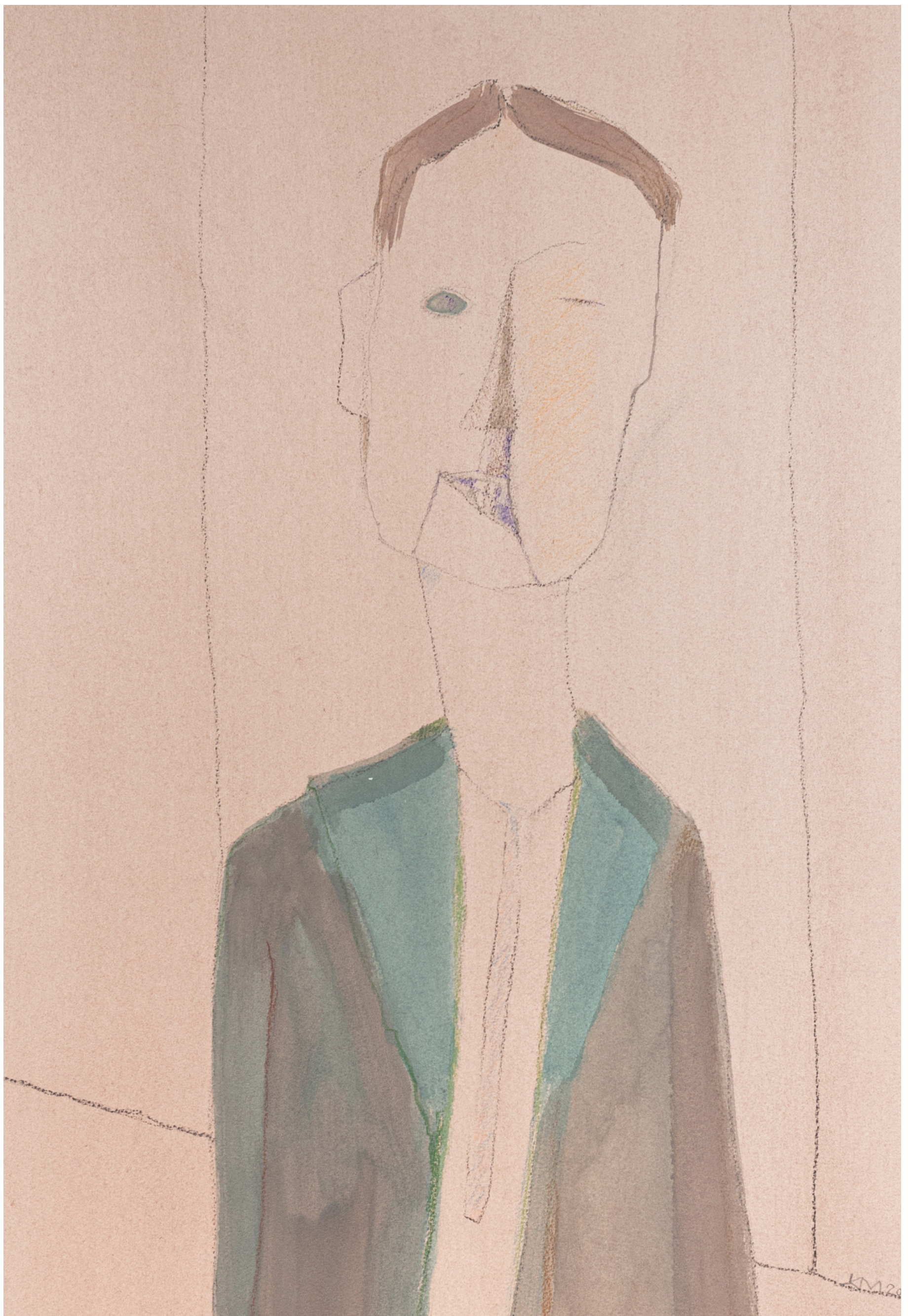
OEUVRE ISSUE DE LA COLLECTION LES GUEULES CASSÉES DE L'ARTISTE JEAN-CLAUDE MORICE